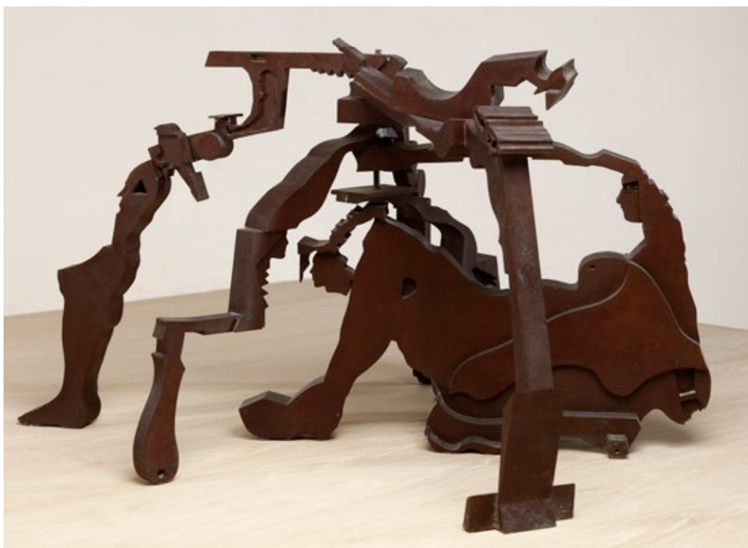
Mujer reclinada 1985, Nova York 50x100x46,5 cm Bronce pátina avermellada; peza única