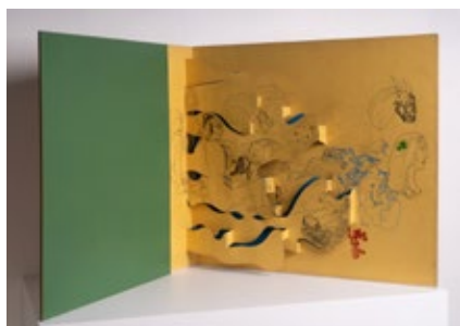
Humano, demasiado humano , 1963-2018, Madrid. 39x16x16 cm Arxila e arame; peza única