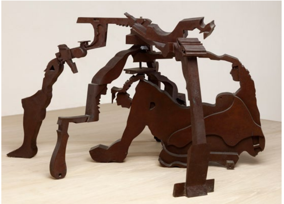
Mujer reclinada 1985, Nueva York 50x100x46,5 cm Bronce pátina rojiza; pieza única