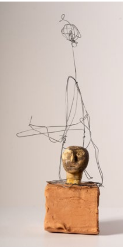
↑ Humano, demasiado humano , 1963-2018, Madrid. 39x16x16 cm. Arcilla y alambre; pieza única