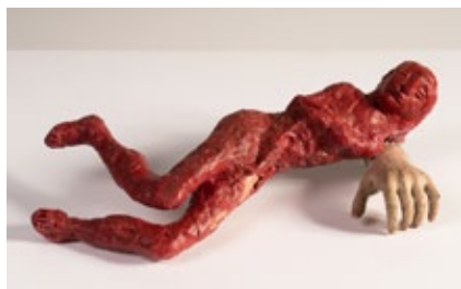
↑ Encantamiento , 1977, ediciones Poligrafa 128x57,5 cm En el sol familiar , 2019-2020, Madrid. 24x31x15 cm. Arcilla y cera; pieza única

A través de una selección de 120 obras –principalmente esculturas–, la muestra recorre su extensa trayectoria, con más de seis décadas en activo, y sus diferentes etapas creativas, incluyendo recientes obras de gran formato y arcillas datadas en los últimos cinco años.