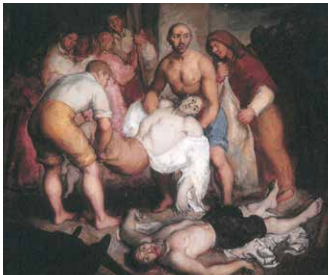
(1) Os afogados , 1946, Isaac Díaz Pardo. Colección de Arte ABANCA