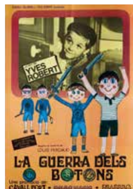
Cartel, La Guerre des boutons, 1962. Yves Robert.

Entre as películas seleccionadas atópanse tamén dous filmes galegos, que en forma de fragmento audiovisual ou poster orixinal, estarán presentes na mostra. Trátase de A lingua das bolboretas , de José Luís Cuerda, e Todos vós sodes capitáns , de Oliver Laxe.