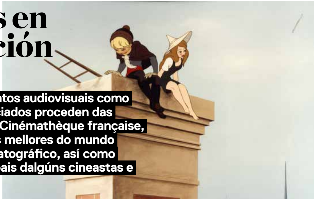
Le Roi et l'oiseau, 1979. Paul Grimault

Tanto os fragmentos audiovisuais como os materiais asociados proceden das coleccións de La Cinémathèque française, consideradas das mellores do mundo no ámbito cinematográfico, así como dos fondos persoais dalgúns cineastas e coleccionistas.