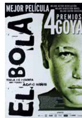
Cartel El Bola , 2000. Acheró Mañas.