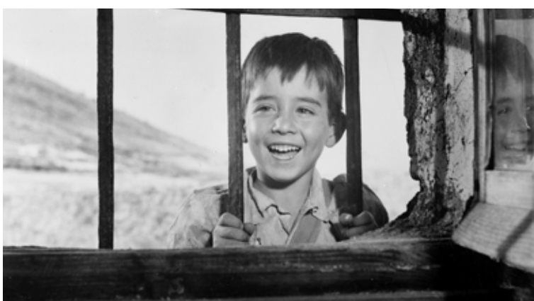
(3) Être et avoir , 2002 - Nicolas Philibert (4) Marcelino, pan y vino , 1954. Ladislao Vajda.

En el cine protagonizado por niños, los espectadores reconocemos algunos de los sentimientos de los personajes, observamos como expresan ciertas emociones, de forma que la película acaba teniendo un profundo impacto en cada uno de nosotros. Mediante un pacto no escrito entre cineasta y espectador, otorgamos al cine el poder de hacer que una historia ficticia nos parezca verosímil y de trasladarnos a unos determinados estados emocionales. Esto se pone de manifiesto especialmente en las películas con protagonistas infantiles, ya que sus alegrías, inquietudes y preguntas son potenciadas durante la proyección; nos despiertan la curiosidad, nos estimulan la imaginación y, además, nos invitan a soñar y a viajar en el tiempo.