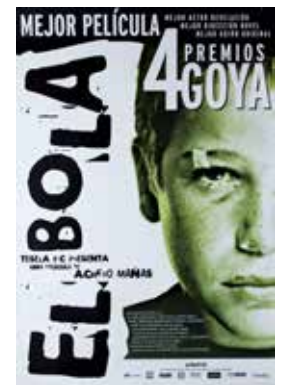
Cartel El Bola , 2000. Achero Mañas.