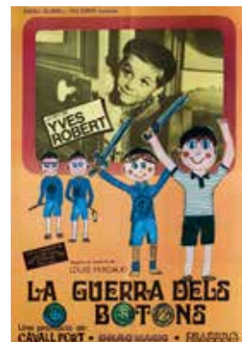
Cartel, La Guerre des boutons , 1962. Yves Robert.

Entre las películas seleccionadas se encuentran también dos filmes gallegos, que en forma de fragmento audiovisual o poster original, estarán presentes en la muestra. Se trata de La lengua de las mariposas , de José Luis Cuerda, y Todos vós sodes capitáns , de Oliver Laxe.