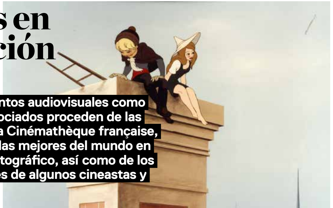
Le Roi et l'oiseau, 1979. Paul Grimault

Tanto los fragmentos audiovisuales como los materiales asociados proceden de las colecciones de La Cinémathèque française, consideradas de las mejores del mundo en el ámbito cinematográfico, así como de los fondos personales de algunos cineastas y coleccionistas.