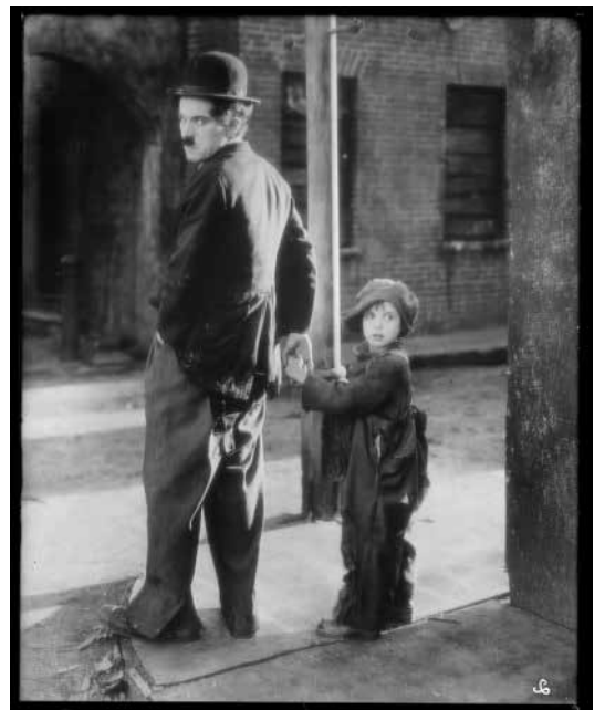
(1) Les 400 Coups , 1959. François Truffaut (2) The Kid , 1921 Charles Chaplin