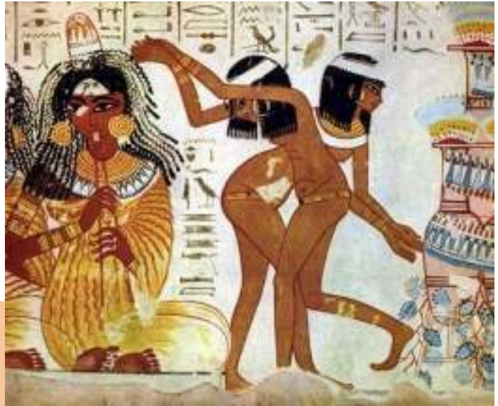
Banquete con músicos e bailarinas (Tumba de Nebamun). Ca.1350 a.C. Museo Británico

Fíxate neste detalle dun fresco pintado na tumba de Nebamun , un escriba do Novo Reino. Hai dúas mulleres que están a danzar ao ritmo das frautas.