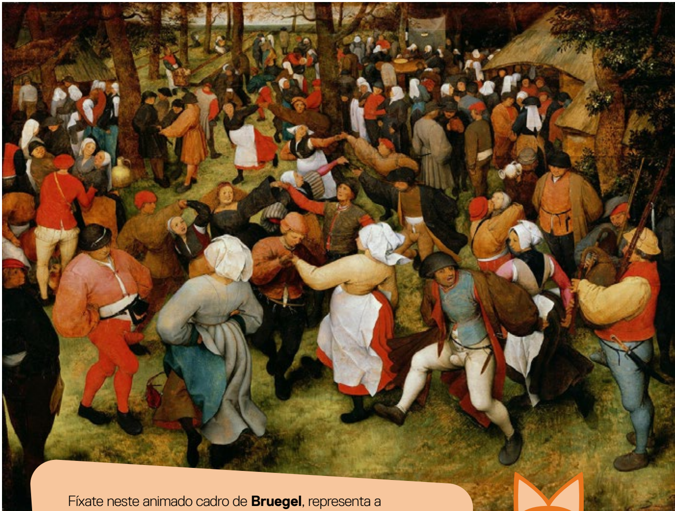
O baile nupcial. Pieter Bruegel o Vello. 1566. The Detroit Institute of arts

Durante a Idade Media, a igrexa tentou controlar a danza, prohibíndoa nalgúns casos e noutros transformando as danzas en celebración das estacións en festas cristiás.