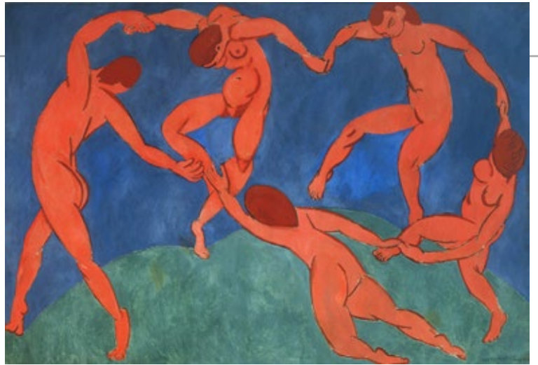
A Danza. Henri Matisse. 1910. Hermitage Museum