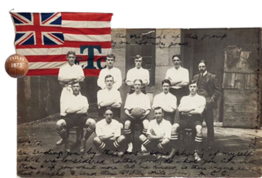
O Exiles de Vigo, en 1905.