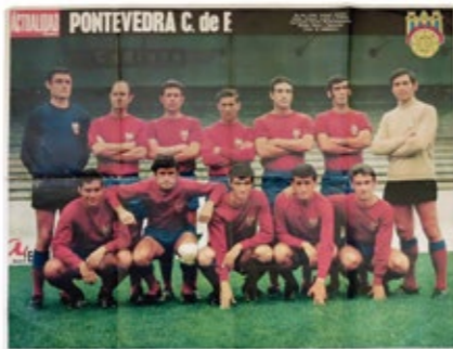
O Pontevedra do Hai que roelo . Tempada 1965-1966

Orla do Racing de Ferrol campión galego na tempada 1928-1929.