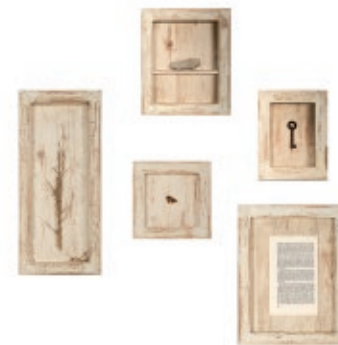
Antía Moure B, 2008. Instalación Colección de Arte ABANCA