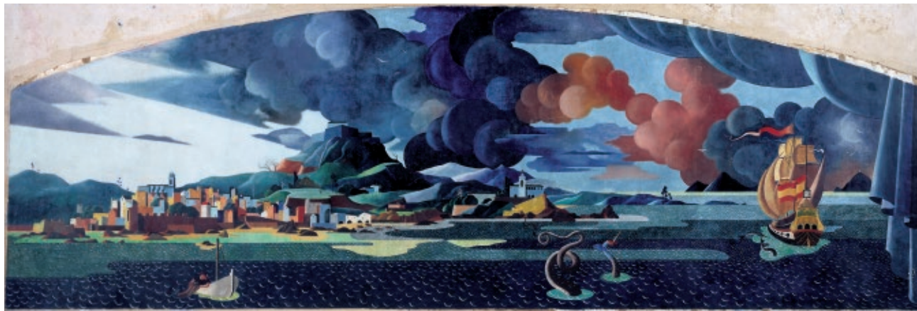
Urbano Lugrís Vista de Vigo, c.1953 Técnica mixta sobre soporte tradicional, arranque strappo, 162 x 488 cm Colección de Arte Afundación