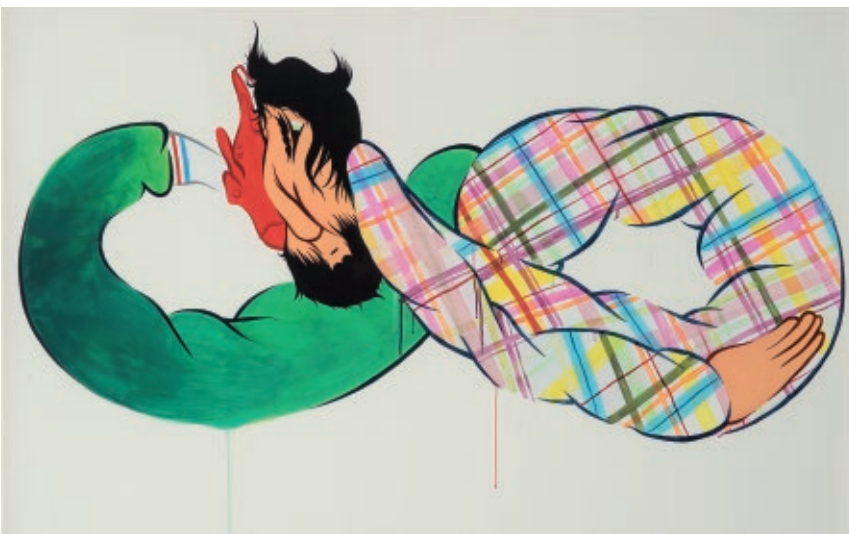
Nano4814 S/t, 2010 Pintura acrílica sobre papel, 140 x 180 cm Colección de Arte Afundación