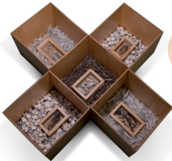
Emilia Salgueiro Rexeneración I, 2002 Instalación, 121 x 123 x 35 cm Colección de Arte ABANCA