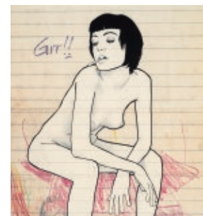
Santi Jiménez La devoradora, 2009 Mixta sobre papel, 110 x 102 cm Colección de Arte Afundación