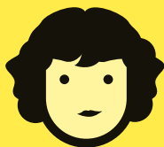
HORTENSE ARCHAMBAULT FESTIVAL D'AVIGNON