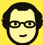
JESÚS CIMARRO FESTIVAL INTERNACIONAL DE TEATRO DE MÉRIDA